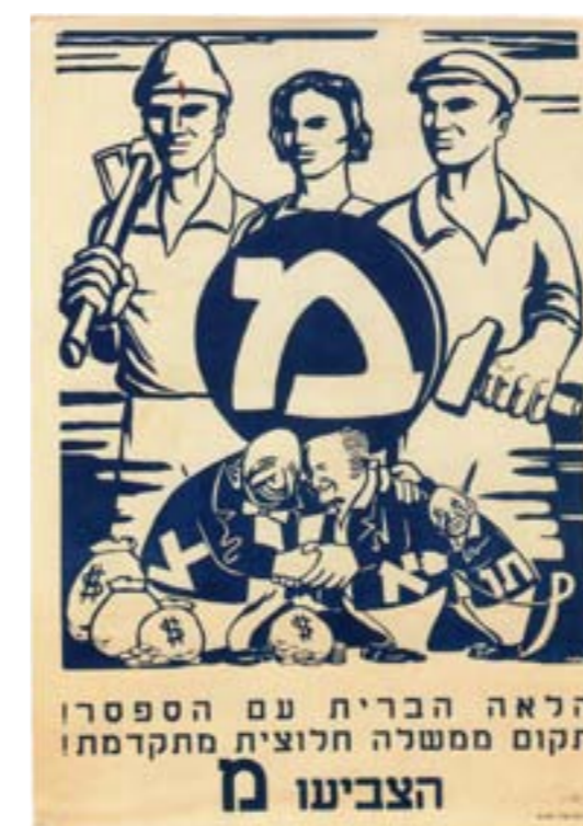
הלאה הברית עם הספרו: כרזת בחירות לכנסת השלישית, שלמה לביא, 1955