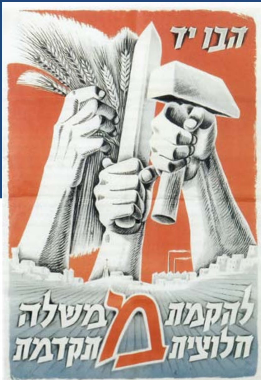
הבו יד: כרזת בחירות לכנסת השלישית, שרגא וייל, 1955

שאלות ולבירורים ניתן לפנות אל מרכז לאוניד נבזלין לחקר יהדות רוסיה ומזרח אירופה merkaznev@savion.huji.ac.il טל' 02-5881959/1770 פקס: 02-5881950